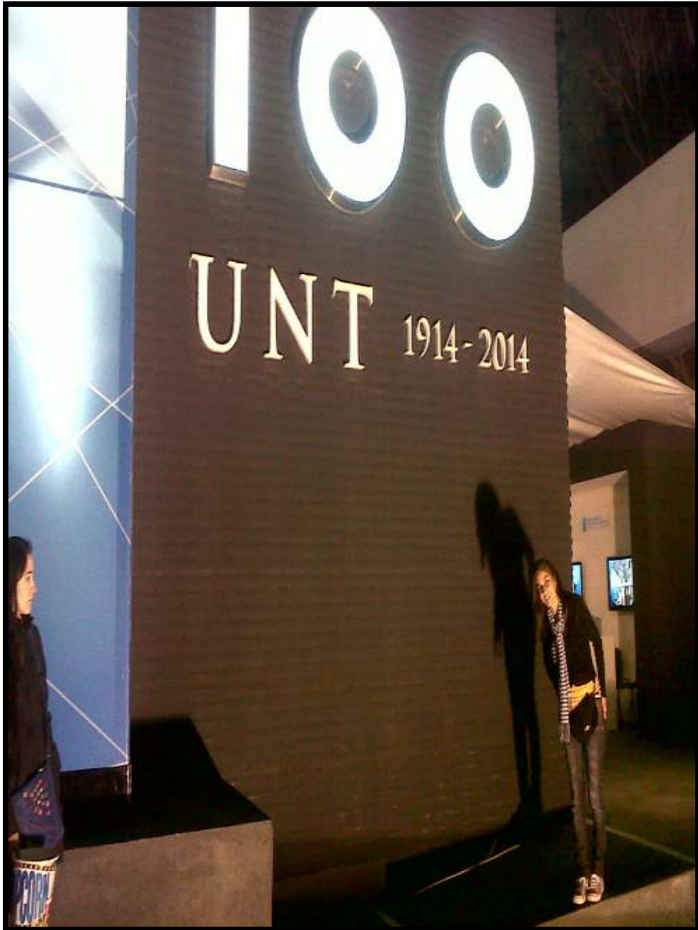
Stand de la Universidad Nacional de Tucumán